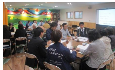
西原校区1・2・3・7町内での会議 令和1年11月18日(月)14:00~