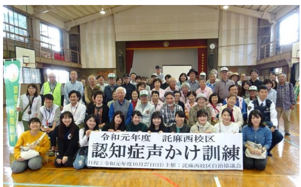
見守りの輪がこんなに広がっています♪