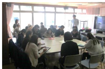
西原校区4・5・6町内での会議 令和1年11月20日(水)10:00~

より身近なことを話し合う為に東バイパスを境に西原校区を二つに分けて会議を開催しました。町内会長、地域づくりに興味のある住民の皆様、介護保険事業者等に集まり頂き、グループワークをして地域の現状とこれから地域の為にどうしていったらよいかを考えました。