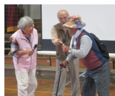
デモンストレーション寸劇