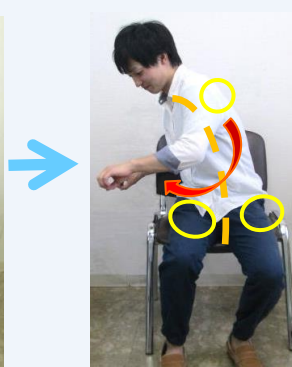
痛くない、無理しない範囲で、テレビCMの合間にでも休み休み行いましょう!