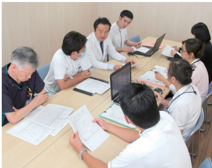
緩和ケアサポートチーム

患者さんと主治医やスタッフとの懸け橋となり、患者さんの「その人らしさ」を支えられるよう活動していきます。