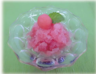
スイカのグラニテ

患者さんの中には「食事が食べられなくても、スープ1口だけでも食べられる」という方もいます。食べる楽しみを味わっていただければと思います、取り組みの1つとして月に1度、旬の食材を使ったスープやデザートをご用意しています。