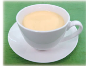
スイートコーンの冷製スープ