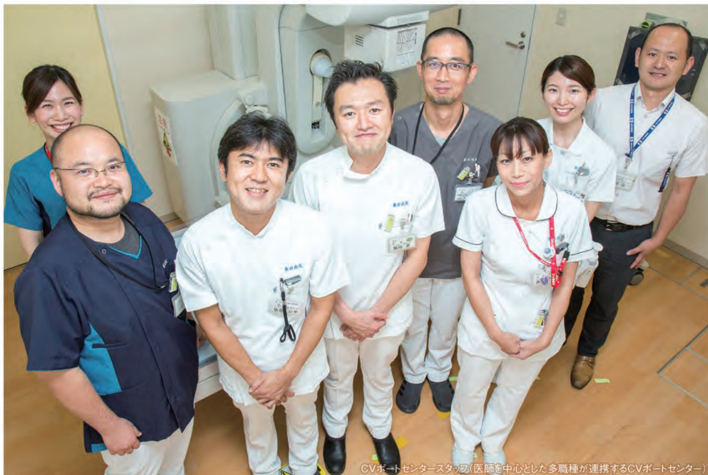
CVポートセンタースタッフ(医師を中心とした多職種が連携するCVポートセンター)