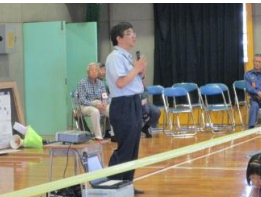
消防は救命活動優先なので避難所は自助・共助が大切！