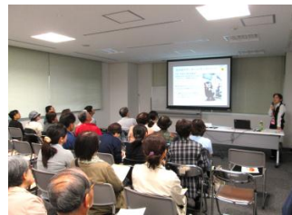
募集人数を超える53名の参加！

● 今後は、養成講座とともにスキルアップ講座を開催し、家族だけでなく地域全体で認知症の方を支えていけるようになるのが目標です！みなさん、今後ご参加お願いいたします。