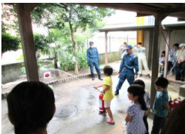
小雨の中、消火器の扱い方等、救命活動の一部を体験！