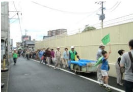
各町内旗を先頭に整列し移動。慌てないことが大事！