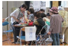
体調管理で異常を発見！