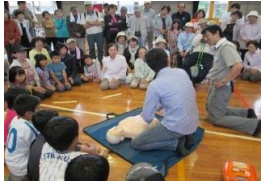
真剣に参加する小学生。未来の救命士がいるかも？