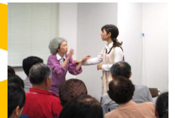
熱演にうなずく人笑うさまさま。