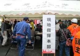
指揮本部設営完了！