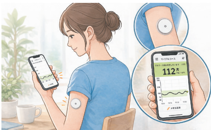
指先採血の負担軽減と、血糖変動の見える化

従来のように毎回指先に針を刺して測定する必要がなく、日常生活の中で血糖の変化を把握することが可能です。