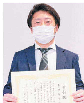
「ご利用者の笑顔を大切に、 これからも努めてまいります」