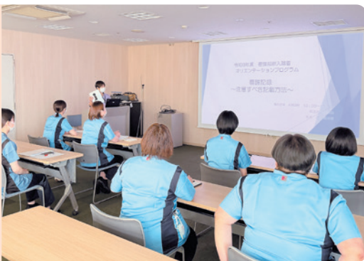
● 看護介護部オリエンテーション