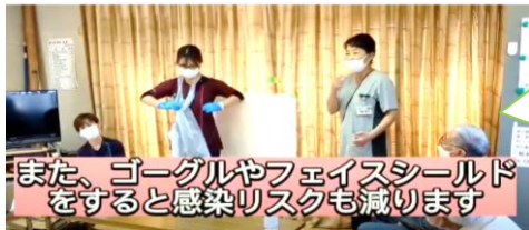
また、Googleやフェイスシールドを すると感染リスクも減ります

LINEでは見られないお役立ち動画を配信中！ ぜひ「チャンネル登録」をして下さい！